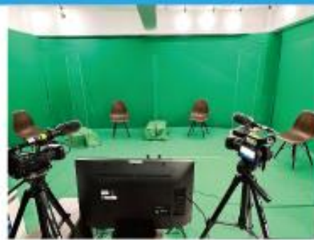
■ 白 or グリーンバック壁面 ■

「トーク番組」「生配信」「インタビュー」「グリーンバック」など 様々なシーン撮影が可能