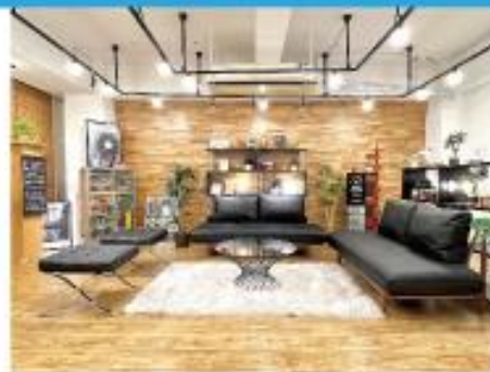
■ 木目壁面 ■