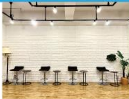
■ 白レンガ壁面 ■